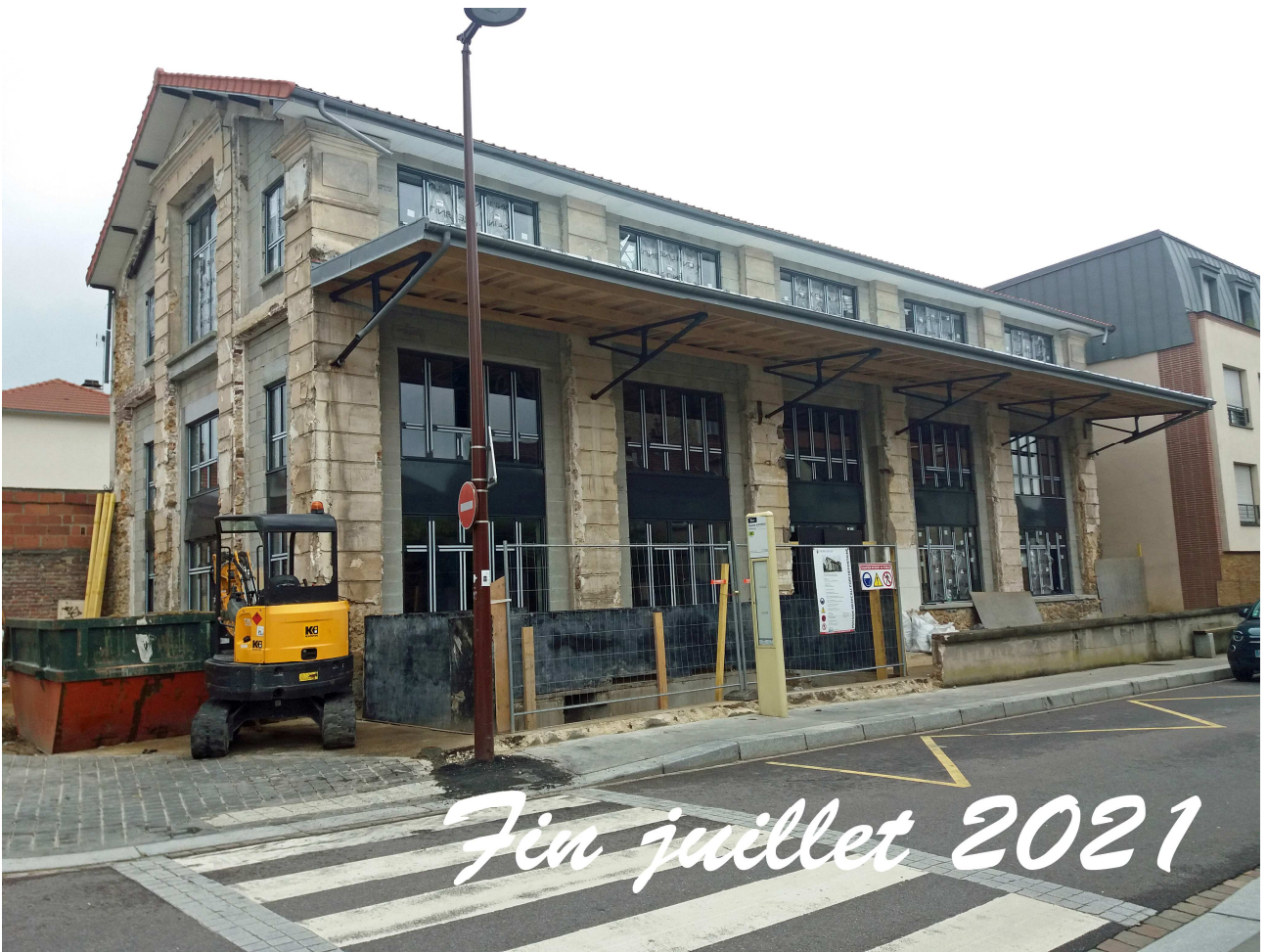
Les huisseries sont fixées, la toiture achevée