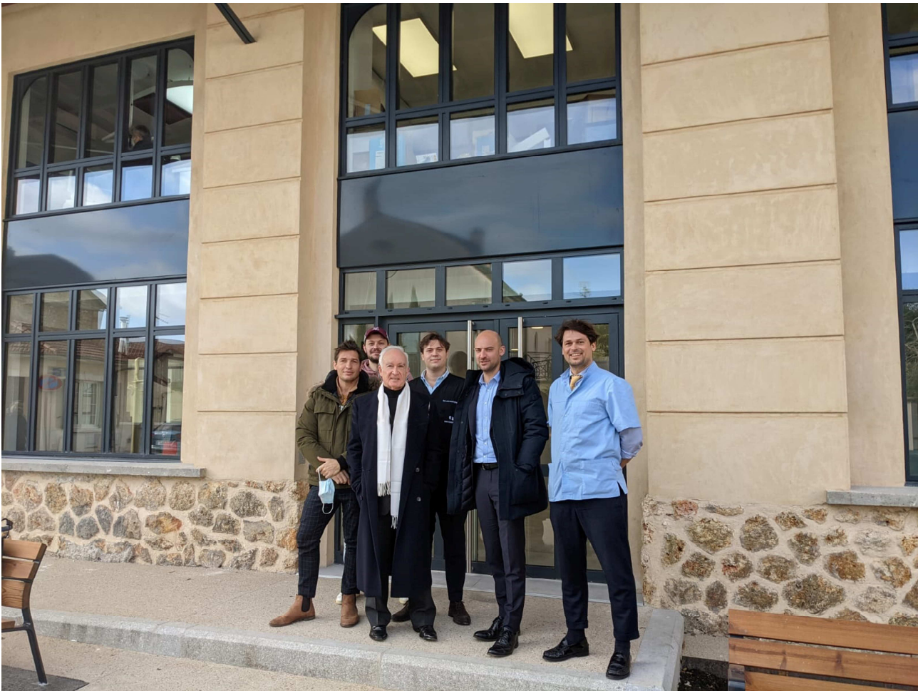
Présence du député Jean Noël Barrot le 21 février 2022