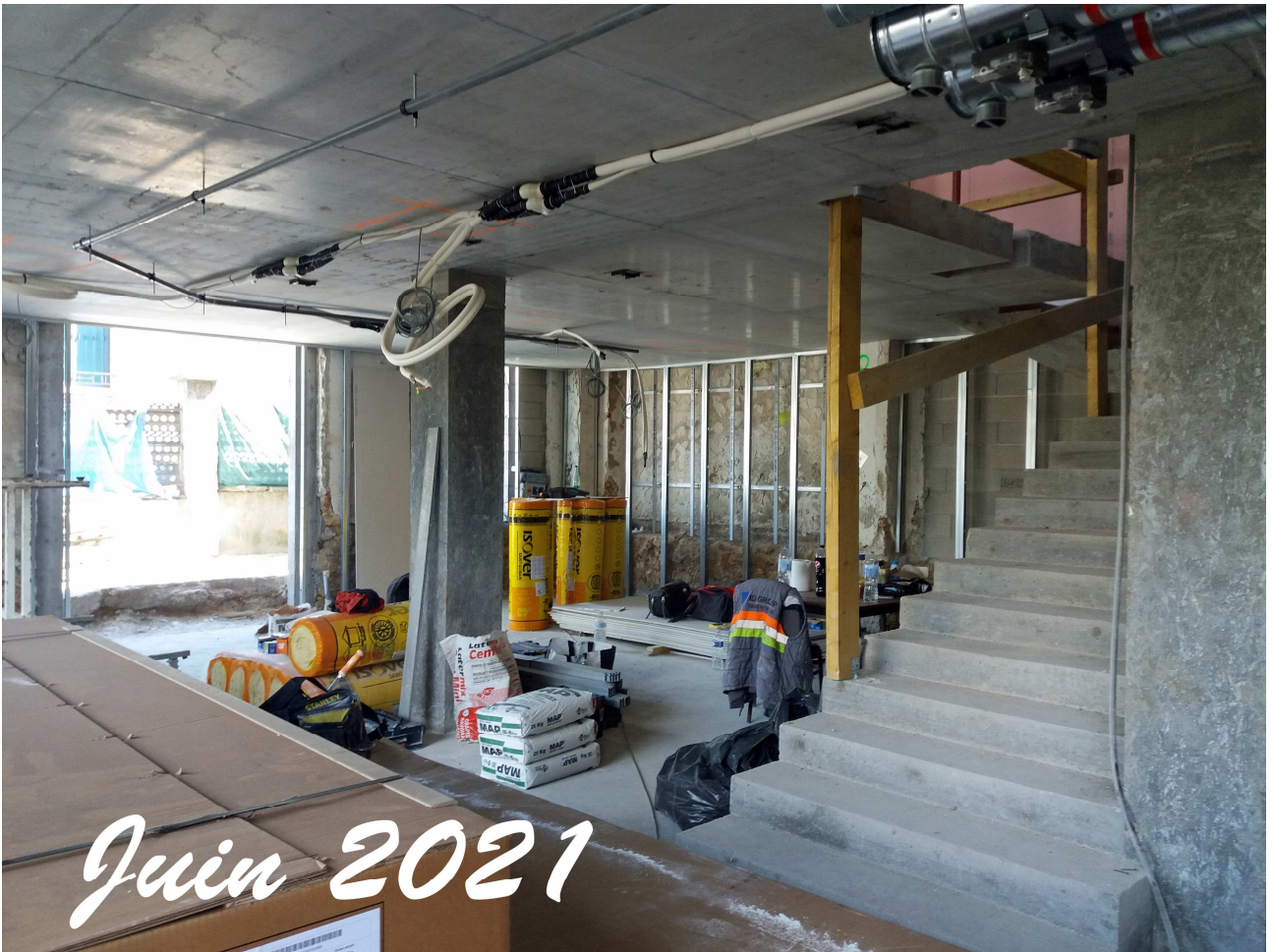
le cloisonnement intérieur et l'installation de l'ascenseur commencent