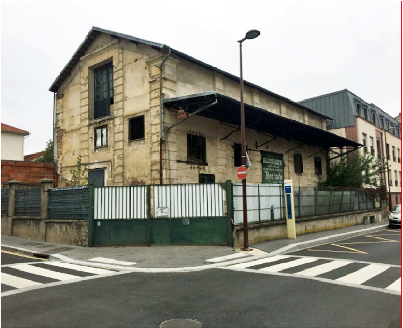
Emplacement du « ferrailleur » avant travaux