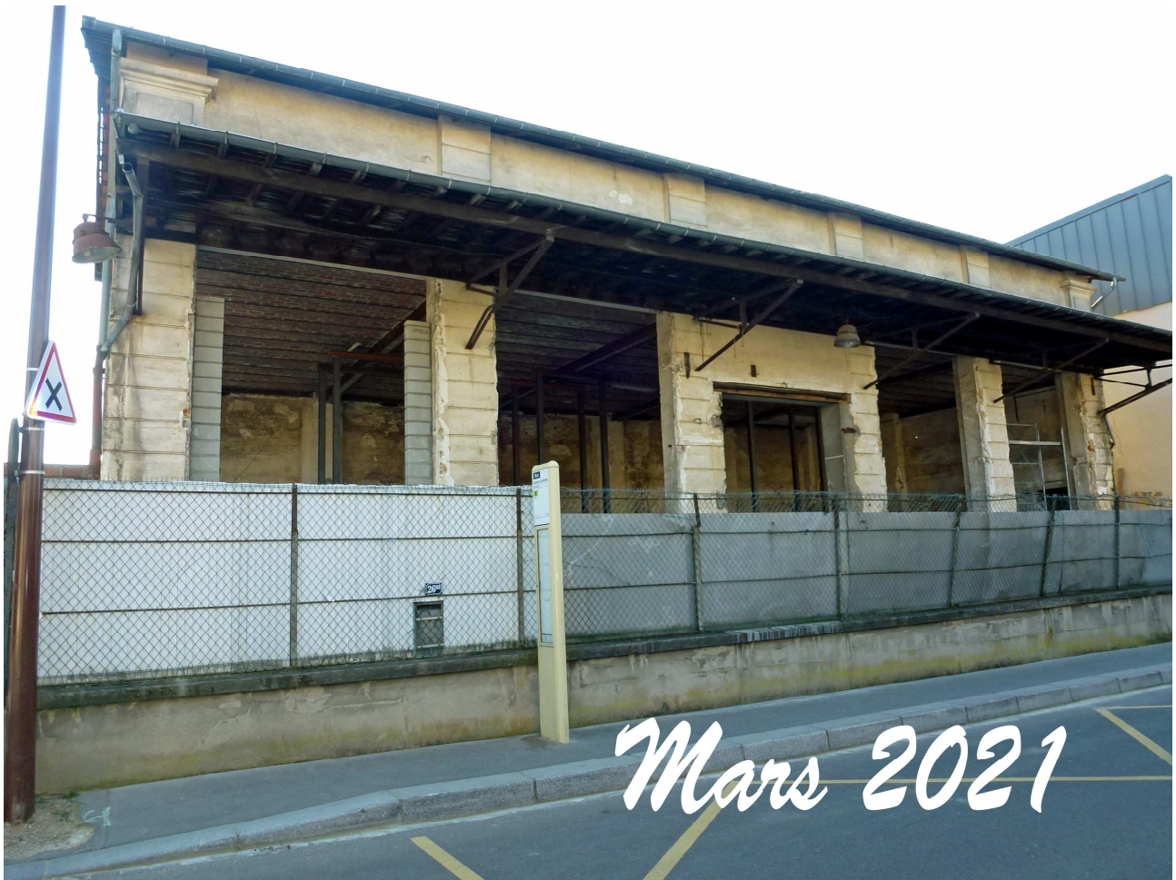
Les assises sont stabilisés, les huisseries et la toiture sont enlevés